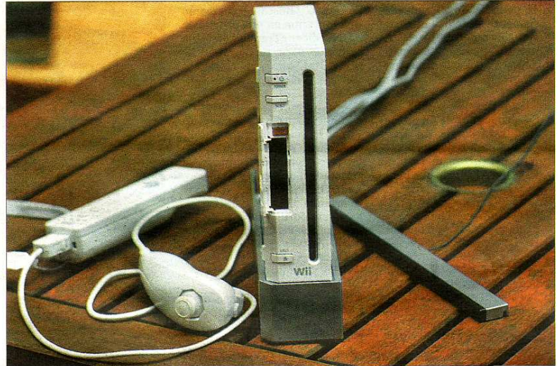
La consola Wii de Nintendo con sus mandos Wiimote y Nunchuk.

El éxito de la consola Wii es mundial. Pese a tener más de